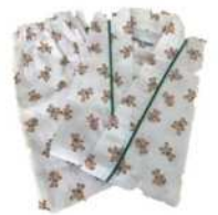
小児用寝巻き (クマさん柄)